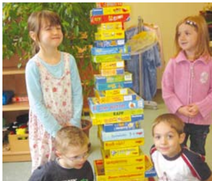
Kinder der Schlappigruppe haben aus ihren beliebtesten Spielen einen Turm gebaut.

Jedes Jahr kommen neue, bunte und verlockende Spielschachteln auf den Markt.