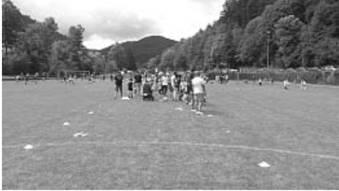
VfR Hornberg Jugendabteilung

Fans angefeuert. Das Turnier wurde im sogenannten Fair-Play-Modus ausgespielt, so dass am Schluss alle Sieger waren und mit einem kleinen Pokal belohnt wurden, welcher sofort stolz präsentiert wurde. Das Premierturnier war insgesamt ein voller Erfolg, welcher nur durch die vielen Helfer möglich war. Bei diesen möchte sich die Jugendleitung des VfR Hornberg hiermit nochmals ausdrücklich bedanken.