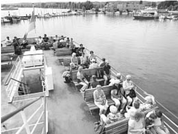
Teilnehmerinnen genießen frische Seeluft

In Friedrichshafen war der erste größere Aufenthalt. Die Freizeit konnte zum Besuch des Zeppelinmuseums mit dem begehbaren Nachbau der Passagierräume von „LZ 129 Hindenburg“ in Originalgröße genutzt werden. Andere bevorzugten das Flanieren entlang der Uferpromenade oder einen Einkaufsbummel in der Innenstadt.