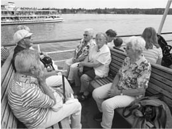
Mit der "Karlsruhe" ab nach Friedrichshafen

meter Luftlinie steigt die Bahn um 448 Meter. Bedingt durch zwei Doppelschleifen benötigt sie zur Überwindung dieses Höhenunterschiedes 26 Kilometer Streckenlänge. Davon verlaufen 9,5 Kilometer durch insgesamt 36 Tunnels. Immer noch ist diese geniale Ingenieurleistung des Erbauers Robert Gerwig zu bewundern.