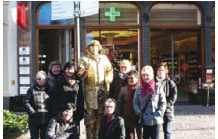
fit for fun

Auf der Heimfahrt waren sich alle einig, dass dies der perfekte Ausflugs- tag war. Termin und Ort fürs nächste Jahr wurden gleich festgelegt: wieder der Samstag vor dem 1. Advent und diesmal geht es nach Ulm an der Donau. Also, gleich im Kalender notieren!