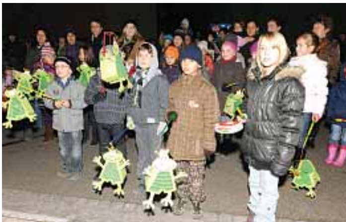
Stimmungsvoller St. Martinsumzug