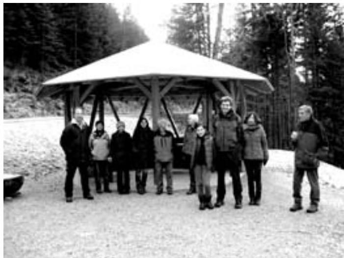
Schutzhütte am Gesundbrunnen