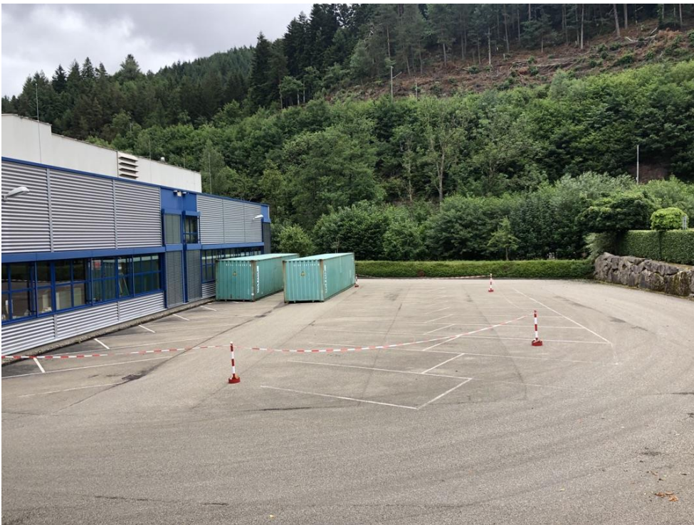
Abb. 2: bestehender Parkplatz

Der größte Teil der Änderungsfläche wird von bestehenden Parkplatzflächen mit Asphaltbelag im Süden eingenommen (ca. 720 m 2 ). Die Fläche hat keine Bedeutung für das Schutzgut Pflanzen/Biotoptypen (s. Abb. 2).