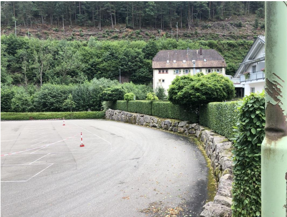
Abb. 3: Trockenmauer mit Hainbuchenhecke

Nester konnten bei einer Begehung am 18.11.2021 durch den o. g. Gutachter und einem Vertreter der UNB nicht festgestellt werden. Zu einem möglichen Vorkommen von Mauer-oder Zauneidechse in diesem Bereich gibt die vorliegende Artenschutzrechtliche Begutachtung (WALD + CORBE 2022) keine Auskunft. Ein Vorkommen kann jedoch aufgrund der vorhandenen Strukturen nicht ausgeschlossen werden.