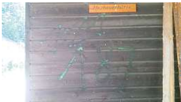
Solche „Kunstwerke“ zieren nun die ganze Hütte

Die Stadt Hornberg behält sich vor, Strafantrag gegen die Übeltäter zu stellen. Wer Beobachtungen gemacht oder Informationen über beteiligte Personen hat, wird gebeten, sich im Hauptamt oder Stadtbauamt zu melden. Vertrauliche Behandlung wird selbstverständlich zugesichert.