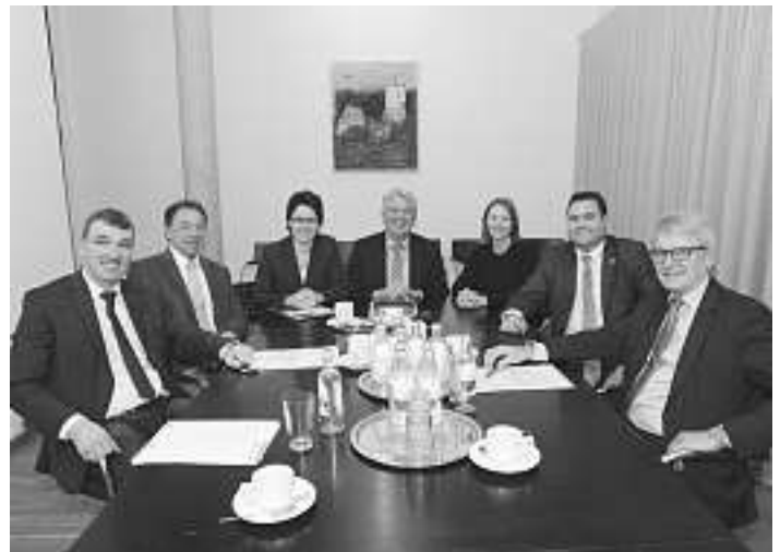
Beim Treffen im Hornberger Rathaus von links nach rechts: Bürgermeister Geppert und Eckert, MdL Gentges, Bürgermeister Scheffold, MdL Boser, Bürgermeister Bauernfeind und Wöhrle