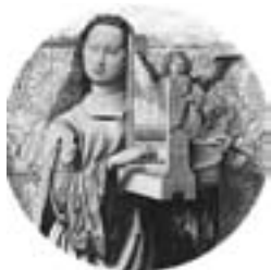
Kath. Kirchenchor „St. Cäcilia“ Hornberg