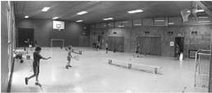
Miniturnier - Platz ist in der kleinsten Halle