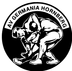
AV Germania Hornberg e.V.