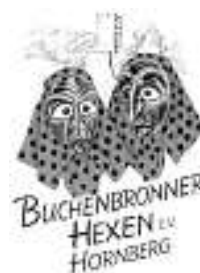
Buchenbronner Hexen e.V. Hornberg