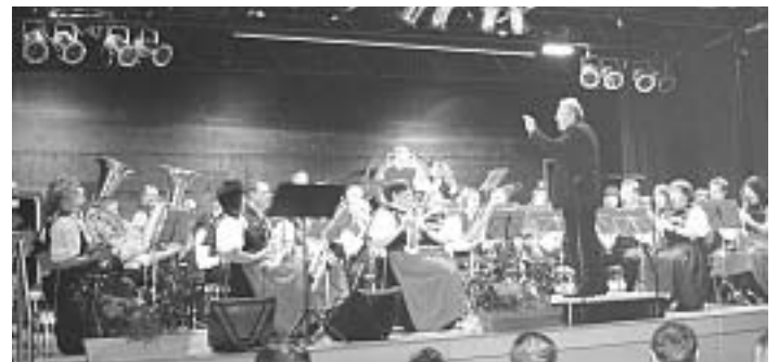
Konzert im Kurhaus ARTRIUM in Bad-Birnbach