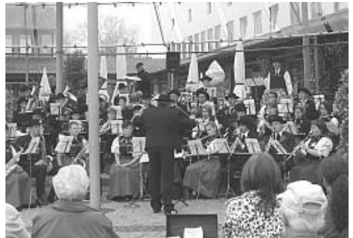
Die Reisegruppe vor der berühmten Kulisse der Wallfahrtskirche in St. Batholomä.