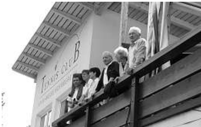
Viele Zuschauer bei den Endspielen - das wäre toll!