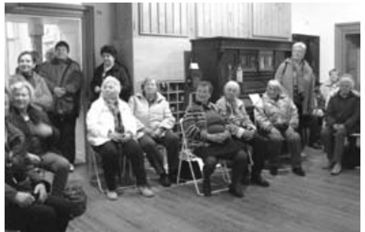
Teilgruppe der Besucher wird über alte Konzert- und Jahrmarktsorgeln informiert

Im Gasthaus „Rose“ ließ man die erlebnisreiche Fahrt mit einem Essen ausklingen.