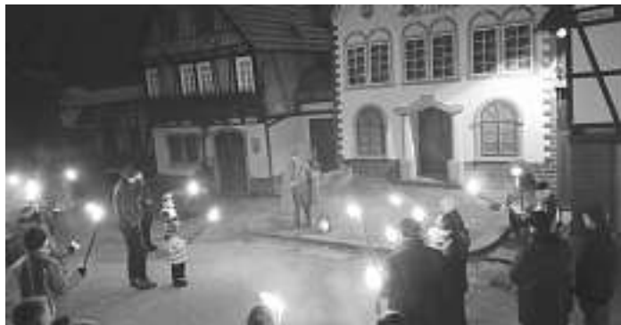
Prolog in der Freilichtbühne Hornberg

Die Tourist-Information Hornberg, unterstützt durch den Fremdenverkehrsförderfond Hornberg veranstalten zum Jahresende am Donnerstag, 29. Dezember 2016 eine Fackelwanderung für Einheimische und Gäste aus Nah und Fern. Pünktlich um 17:00 Uhr fanden sich 37 Erwachsene und 18 Kinder an der Tourist-Information ein und wurden vom Nachtwächter (Fritz Wöhrle) in Empfang genommen. Mit Fackeln ging es dann auf dem Hornberger-Schießen-Weg hinauf auf den Schlossberg. An der Freilichtbühne gab es einen kurzen Stopp und der Nachtwächter gab den Prolog des Hornberger Schießens zum Besten. Zum Schluss konnten sich alle noch auf dem Schlossberg bei Glühwein, Kinderpunsch und Kuchen für den Nach-Hause-Weg stärken.