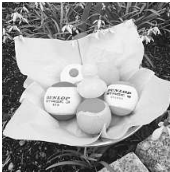
Pünktlich zur Open-Air Saison hat der Osterhase neue Trainingsbälle ins Nest gelegt.