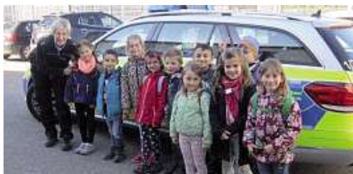
Gruppe vorm Polizeiauto

In zwei Gruppen aufgeteilt, ging es anschließend zu den Polizeiautos und ins „Gefängnis“.