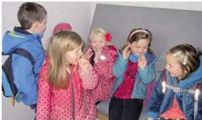
Kinder in der Gefängniszelle

Waren in den Vorjahren die Kinder oftmals erschreckt, wenn sich die große, schwere Tür hinter ihnen schloss, quietschten die diesjährigen Maxis vor Freude, dass sie zusammen mit ihren Freunden im Gefängnis sitzen konnten.