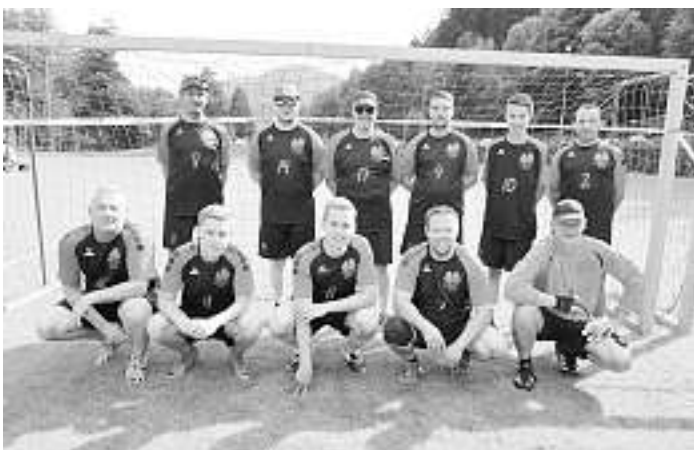
Die Buchenbronner Hexen 2 erreichten beim Elf-Meter-Cup des VfR Hornberg den 3. Platz.