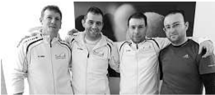
Bildunterschrift: Die Herren Ü35 im St. Georgspokal