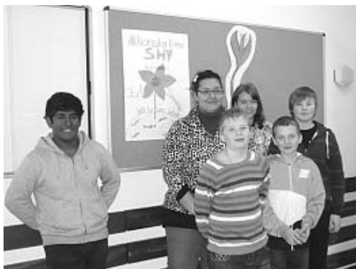
SMV Mitglieder vor ihrem Plakat zum "Tag der Höflichkeit"