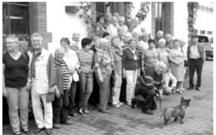
Besucherguppe vor der Winzergenossenschaft

In vier Etagen wird die Hausgeschichte lebendig: vom Stall mit Futtergang über vier originale Gastzimmer aus den 50er Jahren, durch den Keller mit alten Haushaltsgeräten aus der Gastronomie bis zu einem Zimmer mit Bild- und Informationsmaterial zum Fremdenverkehr im frühen 20. Jahrhundert.