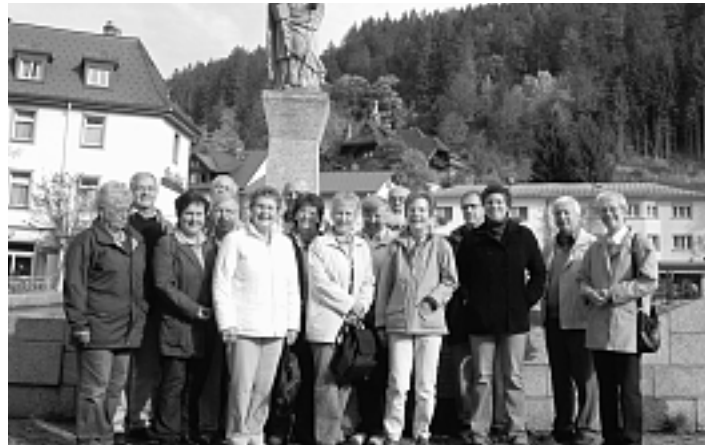
Unser Bild zeigt die Ausflügler vor dem St. Blasius-Brunnen auf dem Domplatz.