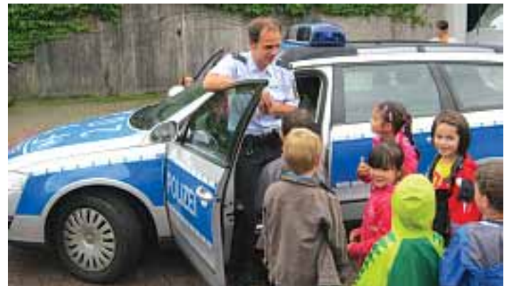
So sieht ein Polizeiauto aus...

Als der 5-jährige von einer Erzieherin gefragt wurde, was er einmal werden will, kam die Antwort prompt: „Polizist – wie mein Papa!“