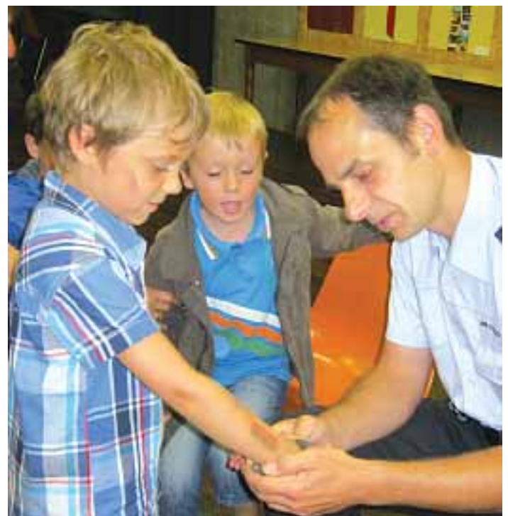
Wie ist das mit den Handschellen?