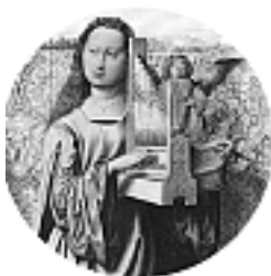
Kath. Kirchenchor „St. Cäcilia“ Hornberg