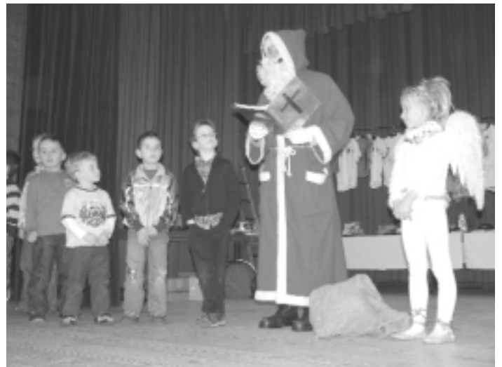
Der Nikolaus –oder war es der Weihnachtsmann?- kam zu den Fußball-Kids, einen hübschen kleinen Engel an seiner Seite.