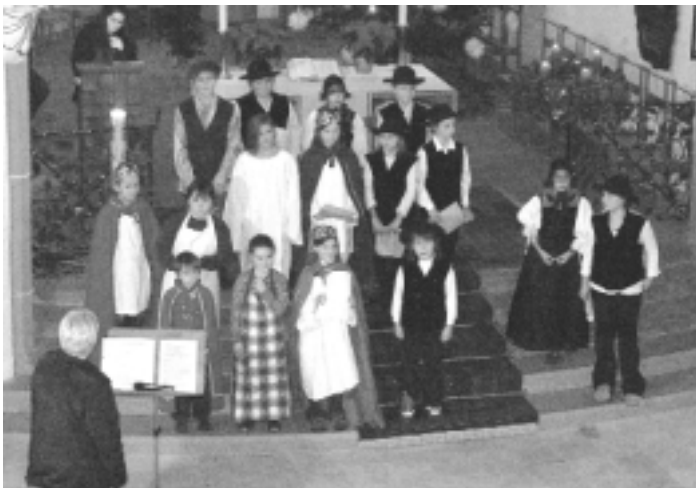
Der neue Kinderchor erfreute mit einem Krippenspiel: Bethlehem kann überall sein

Die Weihnachtstage nahmen in Hornberg einen insgesamt friedvollen Verlauf mit gutbesuchten Gottesdiensten und innigen Feiern hier und dort. Sie wurden von vielen Menschen, wenn sie nicht gerade arbeiten mussten, als willkommene Pause in hektischer Zeit empfunden.