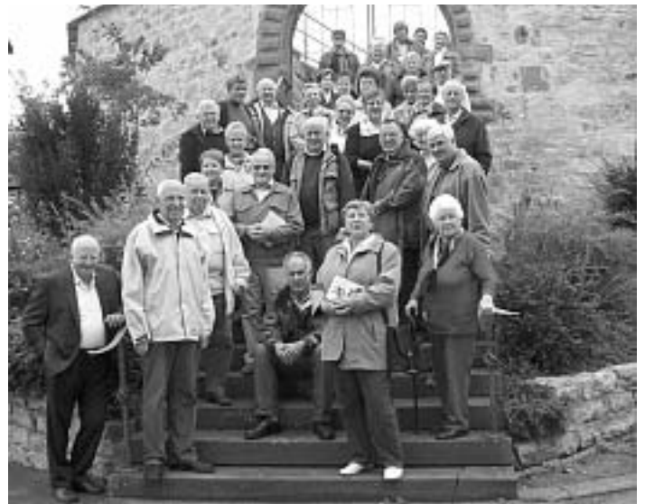
Jahresausflug „Förderverein Stadtmuseum/Verein für Heimatgeschichte“. Das Bild zeigt die Reiseteilnehmer des Jahresausfluges auf der Treppe zur Remigiuskirche in Sulz-Bergfelden.