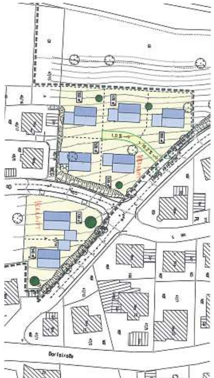
5 freie Bauplätze in Niederwasser „Ob der Kirche“

Die Bauplatzangebote der Stadt stehen aktuell immer auf der Homepage www.hornberg.de unter der Rubrik Wirtschaft – Bauplatzangebote. Auskünfte erteilt Hauptamtsleiter Oswald Flaig, Zimmer 13 im Rathaus, Telefon (07833) 793-41. E-Mail: oswald.flraig@hornberg.de