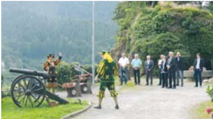
Salutschüsse für die Regierungspräsidentin

Für ihren Antrittsbesuch in Hornberg am 7. August nahm sich die neue Chefin des Regierungsbezirks Freiburg, Regierungspräsidentin Bärbel Schäfer die Zeit, um sich über die besonderen Herausforderungen einer Gemeinde im ländlichen Raum zu informieren. Bürgermeister Scheffold nutzte die Gelegenheit, ausführlich über die aktuellen und geplanten Projekte in Hornberg und den Ortsteilen zu berichten. Nach einer standesgemäßen Begrüßung auf dem Schloßberg mit dem Prolog des Hornberger Schießens und Böllerschüssen durch den Historischen Verein wurde im Sitzungssaal des Rathauses über Themen wie Stadtsanierung, Sporthalle, Ausbau der Eisenbahnstraße, Außenbereichsstraßen und Offenhaltung der Landschaft diskutiert.