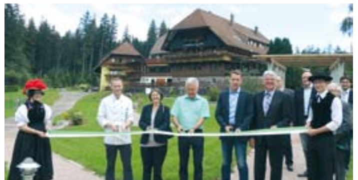
Feierliche Eröffnung der Außenanlage des Landhauses Lauble

Den Abschluss des Gemeindebesuches bildete die Eröffnung der neuen barrierefreien Außenanlage des Landhauses Lauble auf dem Fohrenbühl, die aus LEADER-Mitteln gefördert werden konnte.