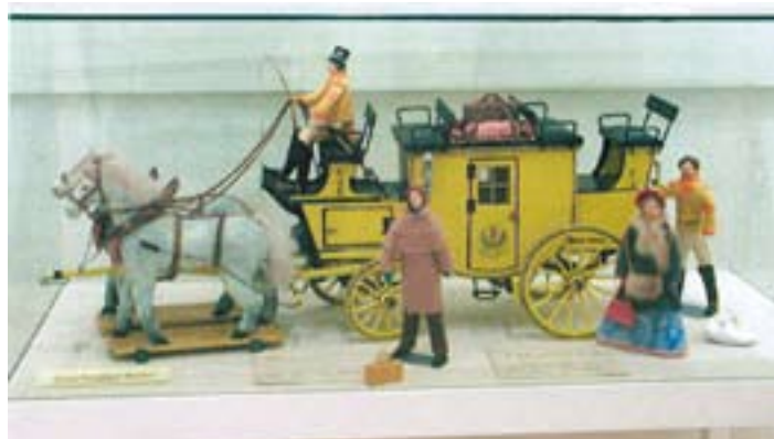
Die großherzoglich-badische Postkutsche

In seinen Werken wird Armin Gotthans unvergessen bleiben. Adolf Heß