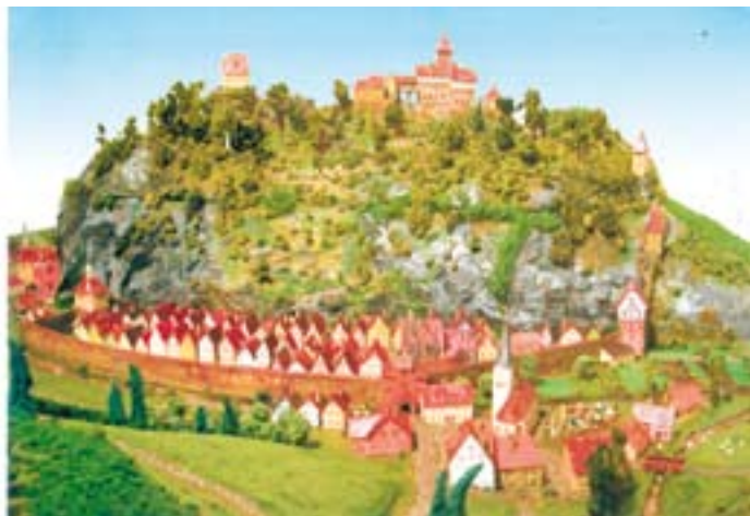
Das Modell von Stadt und Schloss Hornberg vom Jahre 1590 im Maßstab 1:400