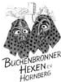
Buchenbronner Hexen e.V. Hornberg

Ab dem 28.08.2012 trainieren unsere "Aktiven" und ab dem 04.09. ist unsere "Jugend" wieder im Training. Die "Schrupper" sind wieder am 31.08. dran.