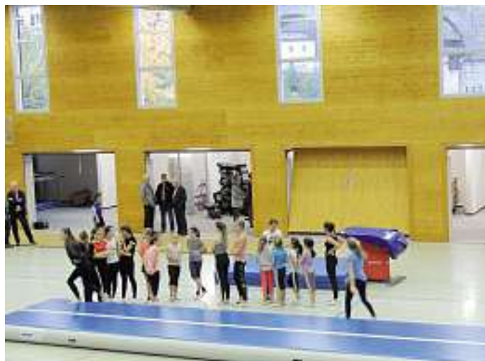
Training der jungen Turnerinnen