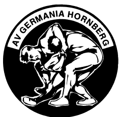
AV Germania Hornberg e.V.