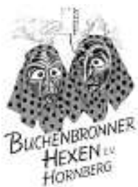
Buchenbronner Hexen e.V. Hornberg

Schülertraining jeweils Dienstag + Donnerstag von 17:30 - 19:00 Uhr, außer in den Ferien. Aktiventraining jeweils Dienstag + Donnerstag von 19:15 - 21:00 Uhr.