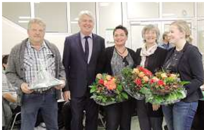
Dank an die Mitarbeiter