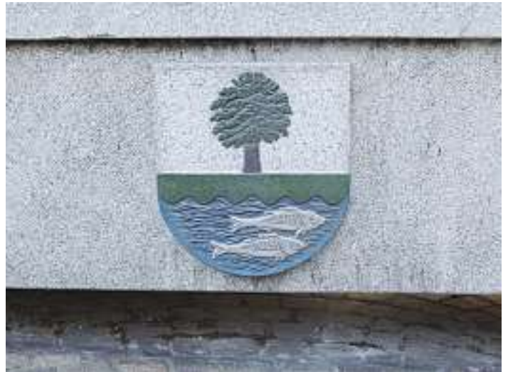
Das Wappen zeigt einen grünen Laubbaum mit zwei silbernen Fischen

Wappen der ehemaligen Gemeinde Niederwasser aus einer Granitplatte kunsthandwerklich herausgearbeitet. In Originalfarben wurde das eindrucksvolle Motiv farbig gestaltet und hat damit eine besondere und schöne Ausdrucksform erhalten. Das Wappen zeigt in geteiltem Schild oben in Silber einen grünen Laubbaum mit schwarzem Stamm auf der Teilung, unten in Grün einen erhöhten blauen Wellenschildfuß, darin zwei silberne Fische übereinander. Der bereits 1998 errichtete Dorfbrunnen hat jetzt nochmals eine gelungene Aufwertung erhalten. Bei der offiziellen Übergabe war die Freude umso größer, weil Steinmetzmeister Marc Fries bekannt gab, dass das komplette Werk von seiner Firma für das Dorf Niederwasser gestiftet wird.