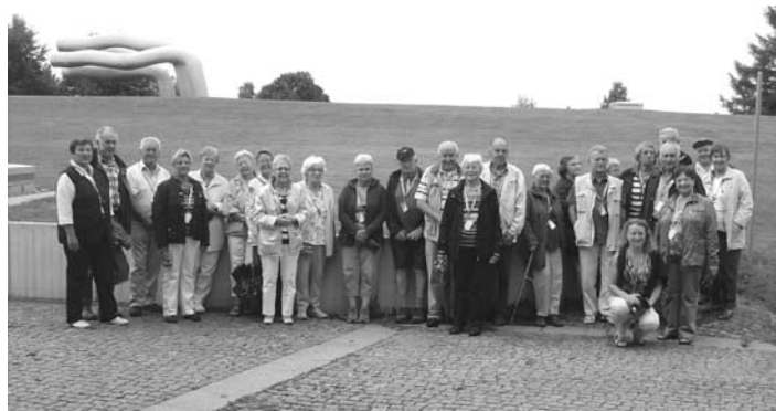
AWO-Besuchergruppe auf dem Sipplinger Berg, im Hintergrund links Skulptur von Bildhauerehepaar Matschinsky-Denninghoff, das reguliert fließende Wasser darstellend

Sieger des AWO-Luftballon - Wettbewerbes trafen sich Hornberg. „Das war toll“, so der Tenor bei der Siegerehrung der Kinder, die beim Wald- und Kinderfest der Arbeiterwohlfahrt am Luftballon-Wettflug teilgenommen hatten. Dieser hat nun schon eine jahrzehntelange attraktive Tradition. Nun warteten sie gespannt auf die Siegerehrung. Von den 136 aufgestiegenen Ballons waren 10 Antwortkarten zurückgekommen.