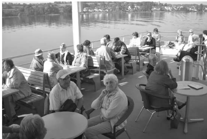
Überfahrt von Überlingen nach Meersburg