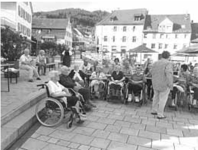
Auf dem Bärenplatz

Am vergangenen Mittwoch besuchten unsere Bewohner den Heimatabend der Trachtengruppe des Historischen Vereins auf dem Bärenplatz. Bei strahlendem Sonnenschein verbrachten sie dort vergnügliche Stunden. Lange danach wurde noch über den lustigen und gelungenen Abend gesprochen. Besonderen Dank gilt hierbei den zahlreichen ehrenamtlichen Helfern, die uns immer wieder dabei unterstützen, damit wir unseren Bewohnern solche Ausflüge ermöglichen können. Vergelt's Gott!