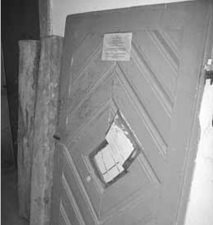
Text und Bild: Adolf Heß

Auf dem aus dem Archiv von Günter Morgenschweis stammenden Foto des erwähnten Gefängnisses in der Hauptstraße 50 sind an der Decke des Gewölbes mehrere Aufhänger zu erkennen. Auch sollen nach der Aussage von Herrn Günter Schondelmaier vormals eiserne Ösen für Fußfesseln auf dem Boden vorhanden gewesen sein. Das lässt die Vermutung zu, dass in diesem Kerker die Gefangenen auch gefoltert wurden.