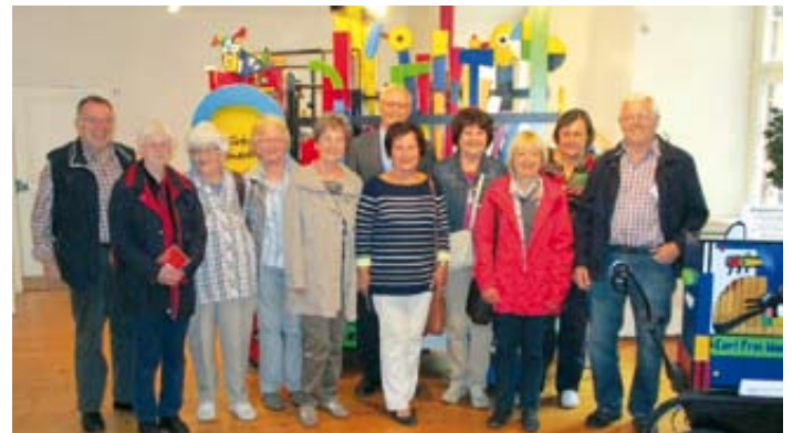
Pensionäre vor der „Altobella Furiosa“, einer Gemeinschaftsarbeit der Waldkircher Orgelbauerwerkstätten, künstlerisch gestaltet von Otmar Alt 1999

Anschließend warf man noch einen kurzen Blick in den Ausstellungsraum zur Geschichte der Badischen Revolution von 1848/1849 in Waldkirch. Hier stieß ein Dokument über den Hornberger Revolutionär A. Herwig, der am 9. April 1848 bei einer Volksversammlung in Triberg sprach, auf besonderes Interesse.