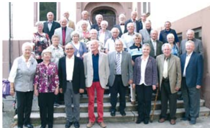
Der Jahrgang 1940 von Hornberg und Reichenbach.