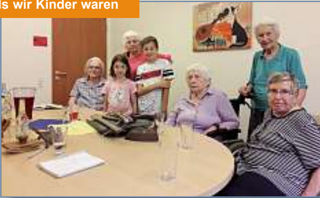
Als wir Kinder waren