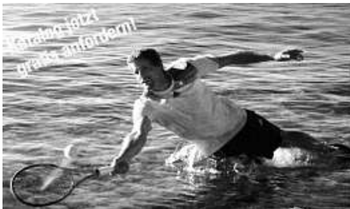
TC im Urlaubsmodus

Der Tennisclub befindet sich mit Beginn der Schulferien im "Urlaubsmodus".