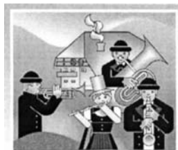
MUSIKVEREIN & TRACHTENKAPELLE NIEDERWASSER e.V.

Die Krabbelgruppe Hornberg trifft sich jeden Donnerstag im evangelischen Gemeindehaus. (9 – 10 Uhr die kleinen Kinder und von 10 – 11 Uhr die größeren Kinder). Die Kinder mit ihren Mamas, Papas, Omas etc. im Alter von 0 – 3 Jahren sind herzlich eingeladen.