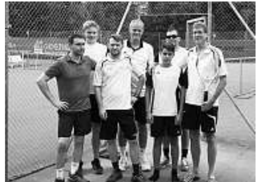
Die 1. Herrenmannschaft des TC GW Hornberg