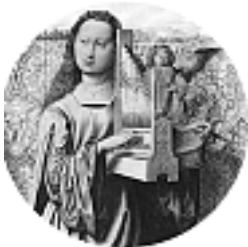
Kath. Kirchenchor „St. Cäcilia“ Hornberg