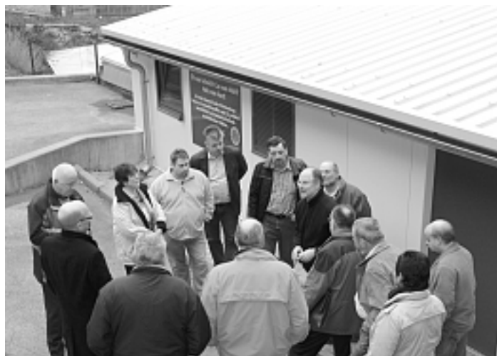
Der Kommunalpolitische Ausschuss besichtigte mit den Kandidaten der Hornberger SPD die Hackschnitzelfeuerung der Brauerei Ketterer.