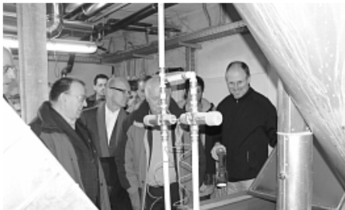
Eng ging es zu im Heizraum der Brauerei, aber die Technik imponierte.