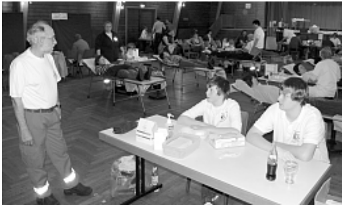
Beim Blutspendeternine sorgten fleißige Helfer für eine zügige Abwicklung.

Die Abwicklung war dank der Mitwirkung von 15 ehrenamtlichen Helferinnen und Helfern, sieben Personen vom Blutspendedienst, vier Ärzten und sechs Jugend-Rotkreuzlern recht zügig und auch das Vesper nach der Blutspende war wieder »ganz große Klasse«, wie man hören konnte. Für die Spender gab es eine Warnweste, wie sie für Kfz-Fahrer vorgeschrieben ist. Der nächste Blutspendettermin wird am 21. Juli stattfinden, in vielen Bundesländern bereits Ferien und somit in einer Zeit, die durch Unfälle und Erkrankungen erfahrungsgemäß einen erhöhten Bedarf an Blutkonserven hat.