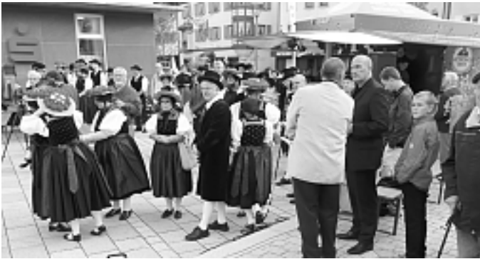
Die Trachtengruppe auf dem Bärenplatz