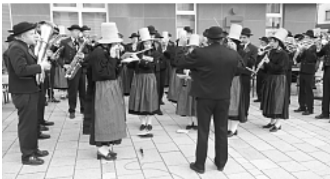
Musikverein und Trachtenkapelle Niederwasser