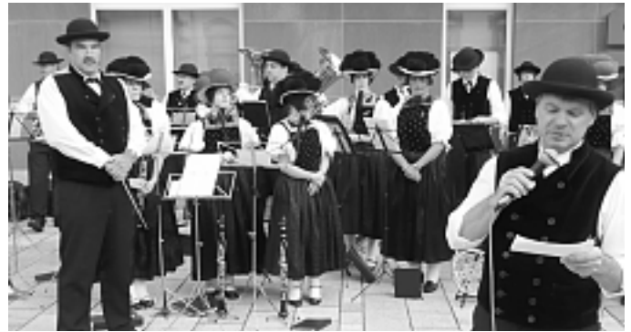
Musik- und Trachtenverein Reichenbach