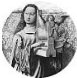
Kath. Kirchenchor „St. Cäcilia“ Hornberg

Am kommenden Freitag ist unsere Narrenkammer ab 20 Uhr geöffnet. Alle Mitglieder sind herzlich eingeladen.