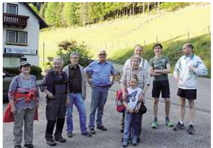
Teilnehmer beim Aufbau des Naturlehrpfades

Der Naturlehrpfad ist von Mai bis November beschildert.