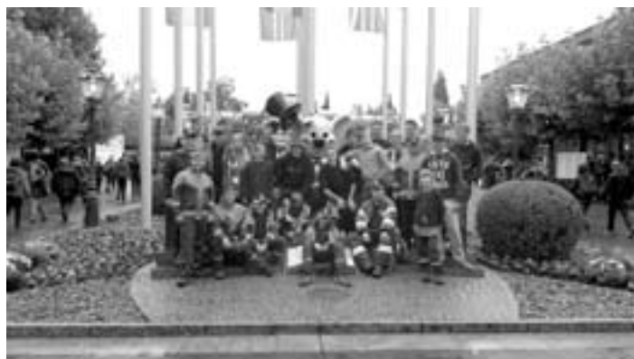
Jugendfeuerwehr Hornberg mit ihren Ausbildern

Am letzten Wochenende vom 13. bis 15.09.2013 feierte die Jugendfeuerwehr Baden - Württemberg im Europa Park in Rust ihr 40jähriges Bestehen mit einen Jubiläumszeltlager und einem Jugendaktionstag im Park. Die Jugendfeuerwehr Hornberg war an diesem Wochenende mit 17 Jugendlichen und 10 Ausbildern vertreten. Insgesamt nahmen 7000 Jugendliche sämtlicher Blaulichtorganisationen, aus vier Nationen am großen Jugendaktionstag im Europa Park teil. Davon übernachteten 1500 Jugendliche mit ihren Betreuern im großen Zeltlager direkt am Park. Am Freitagnachmittag hieß es dann erst einmal einpacken. Getränke, Essen, Zelt, Garnituren,... mussten sicher verstaut werden. Angekommen in Rust ging der Blick erst einmal sehnsüchtig auf den vorbeisauenden Silver Star, jedoch musste zuerst das Zelt aufgeschlagen und eingerichtet werden. Danach folgte dann gemütliches Beisammensein bei Steaks und Würstchen, natürlich frisch von Grill.