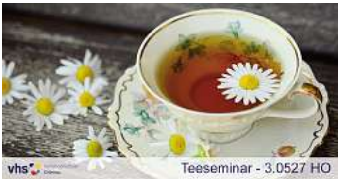
Teeseminar - 3.0527 HO

Für jeden ist ein Kraut gewachsen - Teeseminar (3.0527 HO) Kräutertees, Wohlfühltees, Aromatees mittlerweile gibt es für jedes Befinden neue Teemischungen. Lassen Sie uns bei diesem Workshop die richtige Teezubereitung sowie das Zusammenstellen einer individuellen Teemischung praktisch erlernen. Erfahren Sie auch welche 'Teepflanzen' Sie in Ihrem eigenen Garten anbauen sowie in der Natur ernten können.