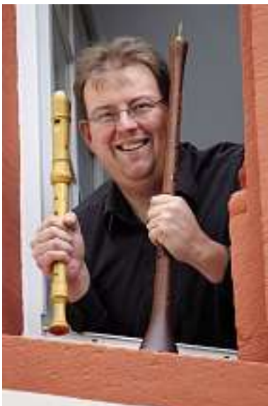
Der neue Hornberger Musikschulleiter und Dirigent der Stadtkapelle