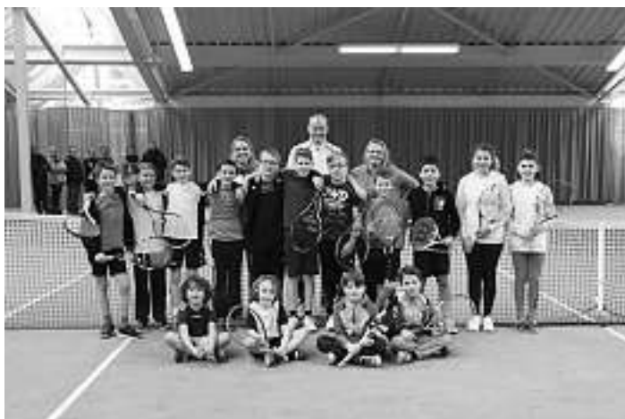
Bestens in Form beim Winterabschluss-Turnier

Am Sonntag, den 18.3., trafen sich 16 Kinder unterschiedlichsten Alters im tief verschneiten St. Georgen in der Tennishalle zum erste Kids- und Jugendturnier des TC GW Hornberg der diesjährigen Saison.